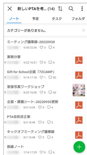
PTA活動に関する資料をノートに集約して保存することで、新任者への引き継ぎも容易。後から検索も可能

3学年しかない中学校のPTA活動のネックは役員が頻繁に入れ替わることで、活動記録や資料をきちんと保存しておけば、新任者への引き継ぎが容易にできるようになります。チャットでタイムリーなやり取りができることに加え、データを整理して保存できることも、LINE WORKSの利点だと思います。