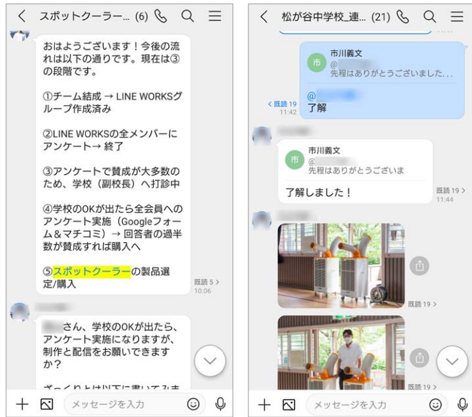
対面せずにLINE WORKS上で情報や意見を交換しプロジェクトを進行

の運営委員会は基本的に対面で開かれていましたが、LINE WORKSによってその必要がなくなり、トークで意見交換や情報共有ができるようになりました。PTAの広報部は学校の活動を伝える広報誌を定期的に作成し、学校向け連絡網サービスで全保護者にPDFで配信されていますが、その原稿チェックのやり取りもLINE WORKSでできるようになったことで時間の節約につながっています。