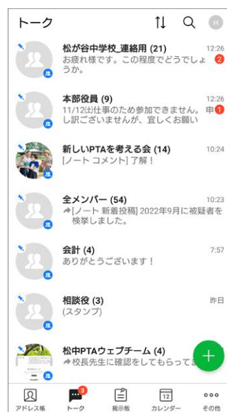
組織やプロジェクト単位でグループトークルームを開設し、情報が速やかに伝達される体制に

組織図に基づく役職のほか、組織を横断して各種の行事やプロジェクト単位でもグループを作成し、メンバー間での情報伝達が速やかに行われるようになりました。LINEを使っていた前年度までは会長が関わっていないグループもありましたが、LINE WORKS導入後は会長と会長付副会長をすべてのグループのメンバーにすることで、活動内容をリアルタイムに把握できるようになっています。