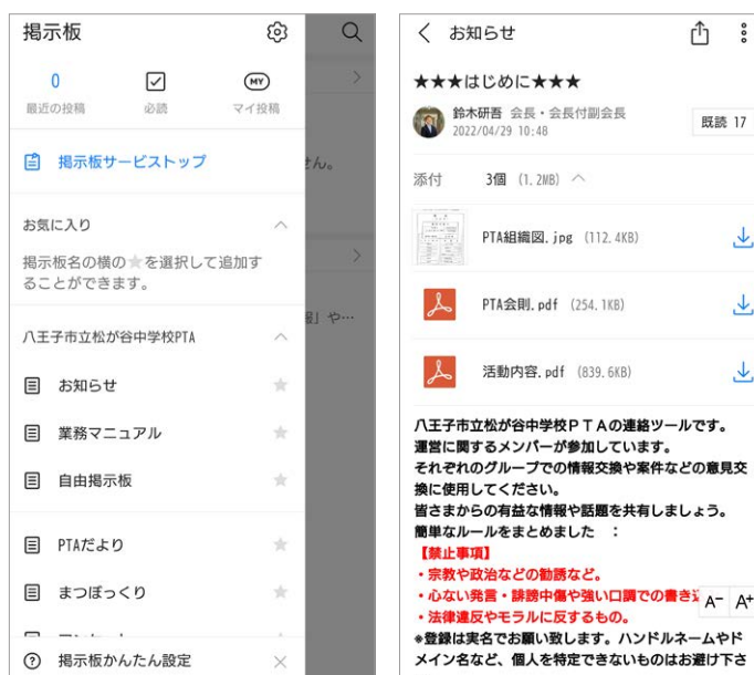
会則やLINE WORKSの運用ルールなどを掲示板で周知。 今後は広報誌の発信などに利用することも検討

現在のところ掲示板には会則と組織図、LINE WORKSの基本的な運用ルールを掲載しているだけです。全保護者がユーザーになったら、学年、クラス、部活といったさまざまなグループに向けた効率よい情報周知にも活用できるはず。また、広報誌も学校向け連絡網サービスではなくLINE WORKSの掲示板にアップすれば、発信がよりスムーズになると思います。