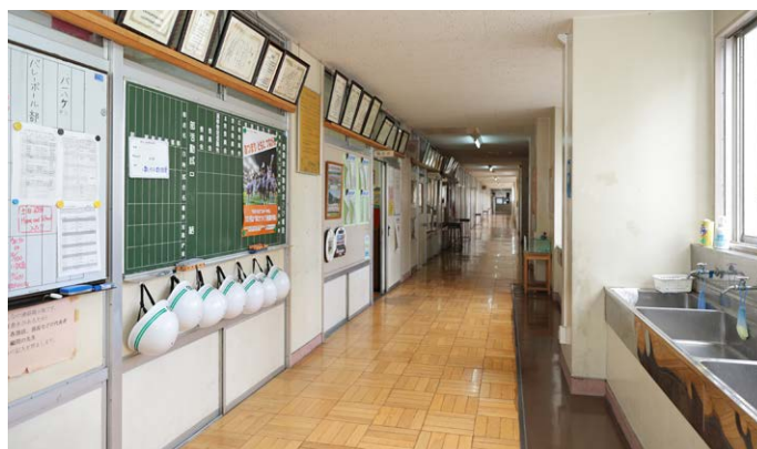
※掲載している内容、所属やお役職は取材を実施した2022年10月当時のものです。

さらに将来的には、松が谷中学校に進学される近隣の小学校の保護者にも利用を広げ、両PTAが足並みを合わせて活動できるようにすることも視野に入れていきます。また、八王子市中P連もLINE WORKSを運用しているので、外部トーク連携機能でつながることで、密な情報共有を図りたいと考えています。