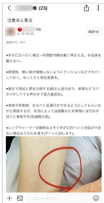
患者に関する重要な特記事項はグループノートに投稿。蓄積できるためグループメンバーがいつでもすぐ閲覧できる