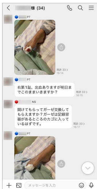
患者ごとのグループを作成。判断に迷った場合は写真や動画を送信して他のスタッフに相談