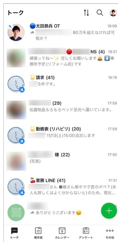
赤丸は看護師、青丸はセラピストといったように、名前やグループ名の前に絵文字を付けることでグループ参加者やカテゴリを見分けやすくしている

現在の具体的な使い方として、訪問看護をするスタッフは1日の始まりに未読のトークをチェックし、勤務表のPDFを見て自分の訪問先を確認します。また、訪問看護を1件終えるごとに他のスタッフへの申し送りをトークで伝えています。「訪問看護ステーションなごみ」では、患者が約230名います。細かな配慮が必要な患者については、その方のお名前前でLINE WORKSのトークグループを作成し、その方の看護に携わるスタッフ全員がいつでも情報を共有できるように工夫しています。