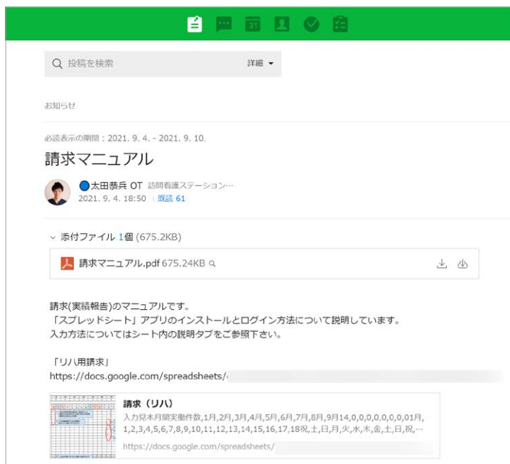
業務マニュアルなどは掲示板にアップ